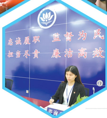
视频/广州日报全媒体记者肖桂来、陈忱子、高鹤涛、庄小龙

监察站的成立有效覆盖了这些监督盲区。广州市纪委监委有关负责人认为,推动监察职能向镇(街)、村(社)延伸,有利于克服上级监督滞后和乏力的问题,同时发挥“从上到下”监督的组织优势和“贴身监督”的天然优势,着力解决群众身边的不正之风和腐败问题,有力推动全面从严治党不断向基层延伸。