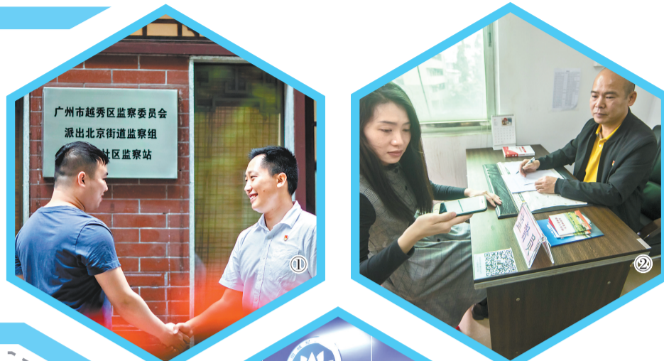
文/广州日报全媒体记者肖桂来、方晴 图/广州日报全媒体记者陈忱子、高鹤涛、庄小龙