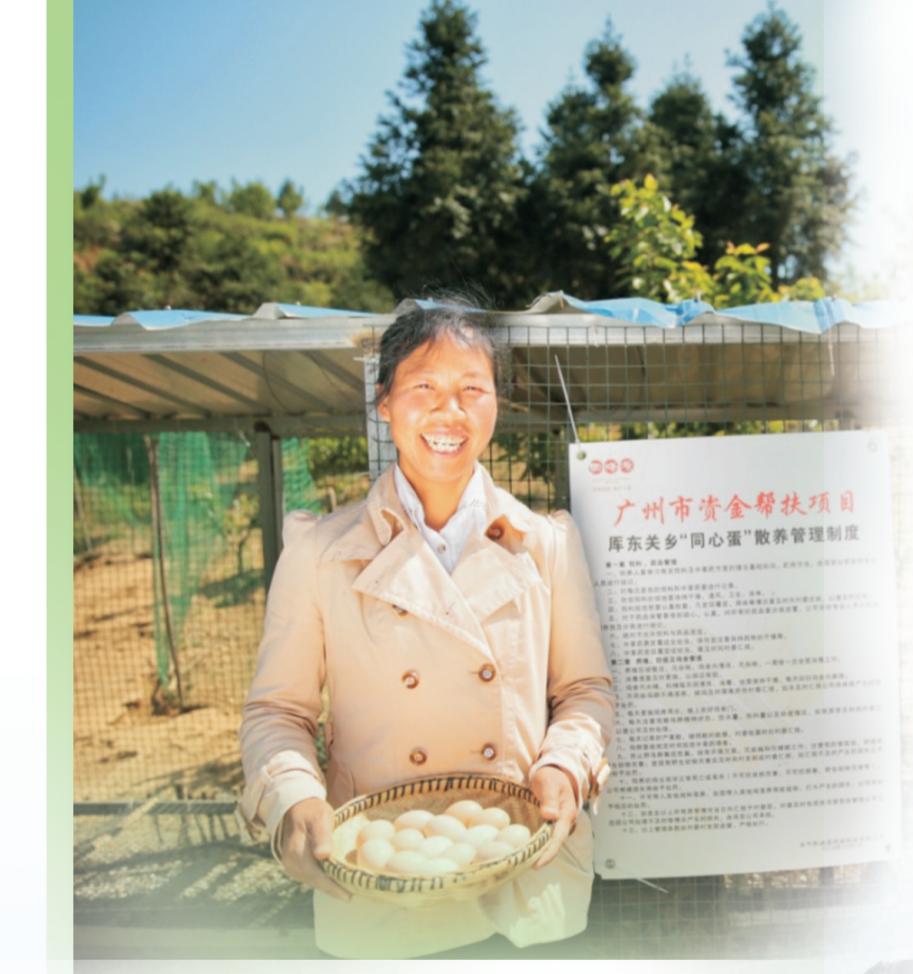
▲毕节市纳雍县库东关乡广州帮扶“同心蛋”项目,消费扶贫助力贫困户精准脱贫。