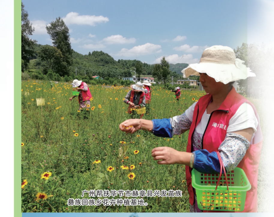
广州帮扶毕节市赫章县兴发苗族彝族回族乡花弄种植基地。