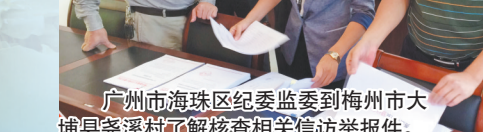
广州市海珠区纪委监委到梅州市大埔县溪溪村了解核查相关信访举报件。

脱贫攻坚效果怎么样,群众说了算。海珠区纪委监委组织对扶贫领域反馈问题整改情况开展“回头看”,回访检查被反馈问题贫困村整改情况;走访未被抽检的贫困村,直接访谈群众,特别是涉信访反映问题的群众,做实监督、倒逼帮扶。2019年来,海珠区对口帮扶的大埔县建档立卡贫困人口4865人中,实现脱贫4861人,脱贫率达99.92%。