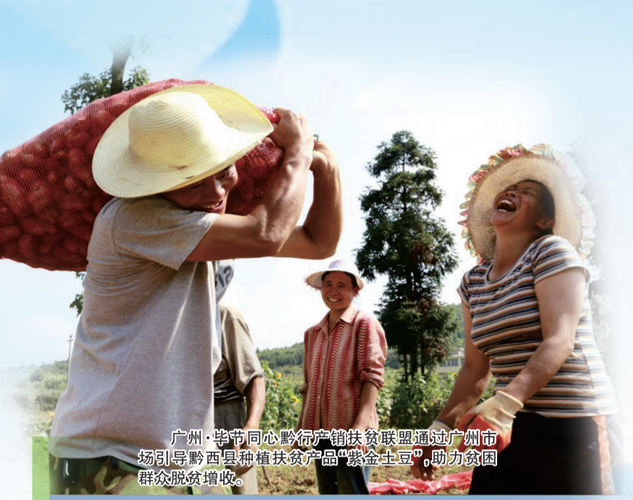
广州·毕节同心产销扶贫联盟通过广州市场引导黔西县种植扶贫产品“紫金土豆”,助力贫困群众脱贫增收。

助力打赢脱贫攻坚战,监督既要有力度,也要有温度。去年,毕节市纪委监委在一次专项监督中发现某镇扶贫资金使用率不高的问题。通过约谈干部、深入核查,查明资金闲置滞留的一个重要原因是审批链条过长、审批程序繁杂,致使项目批复时间延滞,多数项目走完程序后